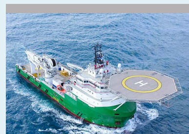
Marinha - Offshore